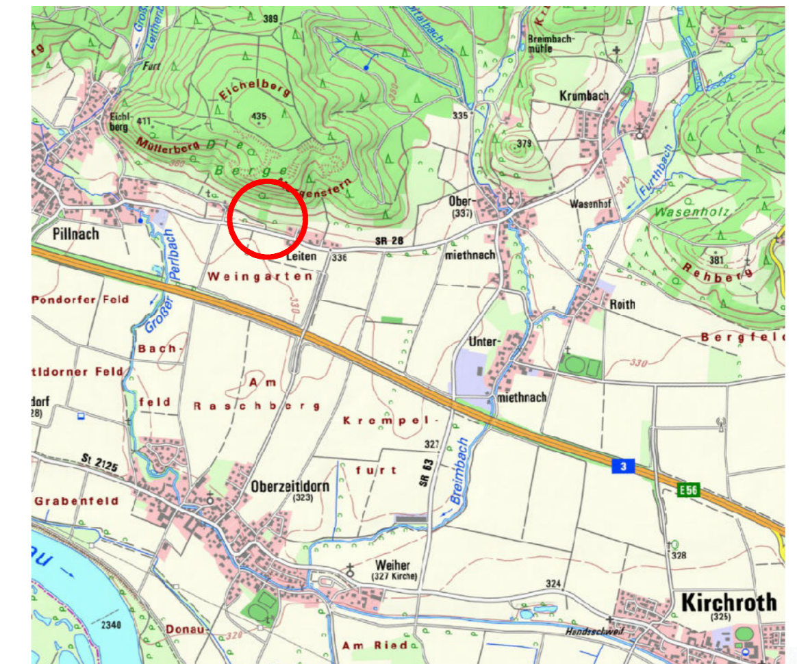
Ausschnitt aus Topographischer Karte des BayernAtlas M 1:25.000