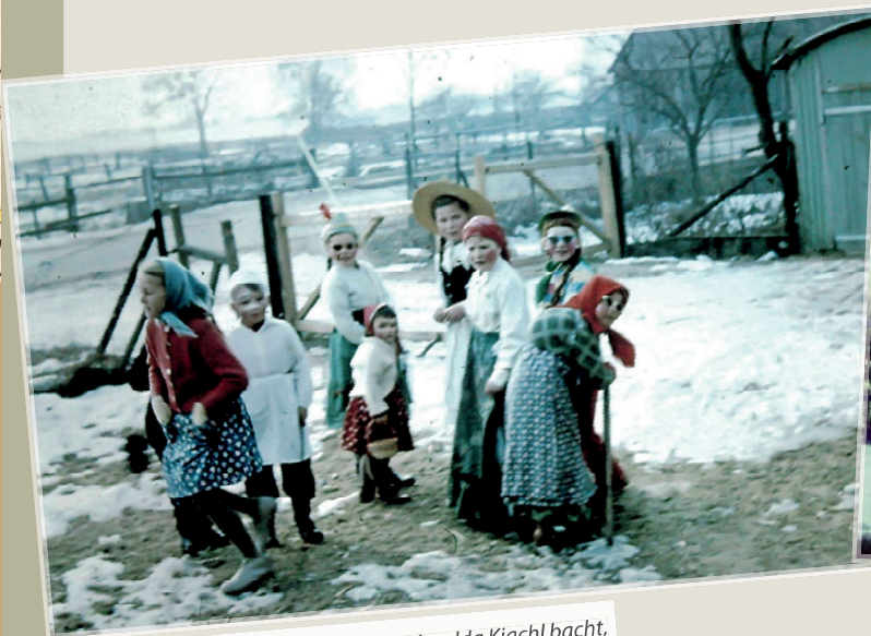
„Lustig ist die Fasnacht, wenn mei Muadda Kiachl bacht, wenn sie aber keine bacht, pfeif ich auf die Fasnacht“