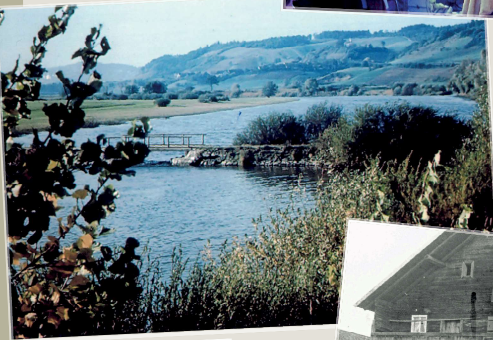
Die „Scherbrücke“ bei Hofdorf zur Gmünder Au, die dem Donauausbau weichen musste