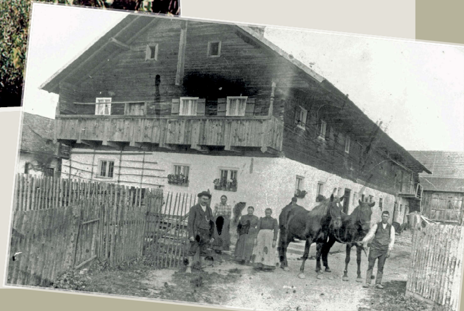
Das „Biendl-Anwesen“ wurde an Maristenkloster vererbt und 1966 an BRD-Autobahn verkauft