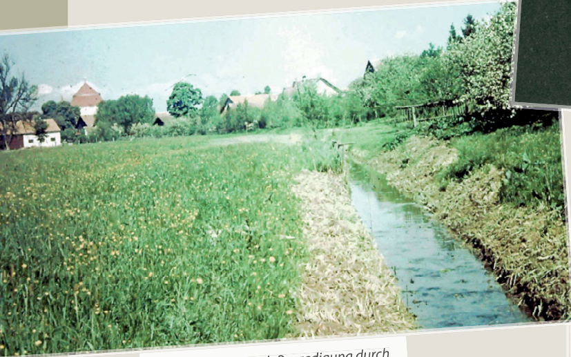
Der Elsengraben nach Begrädigung durch Reichsarbeiter zur Entwässerung der Wiesen