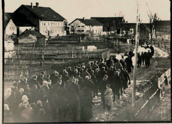
Das ehemalige Rath-Anwesen hatte den Hausnamen „Beck“, weil dort früher eine Bäckerei war