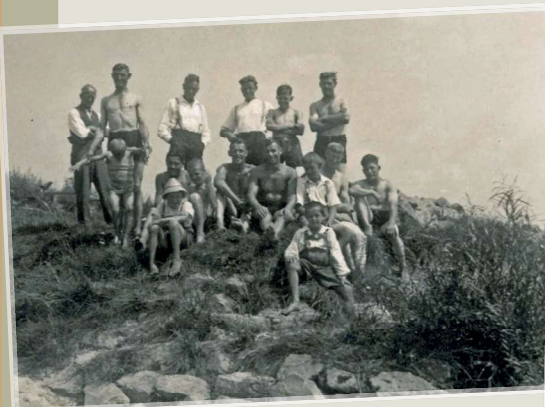
Dorfjugend in den 30er Jahren